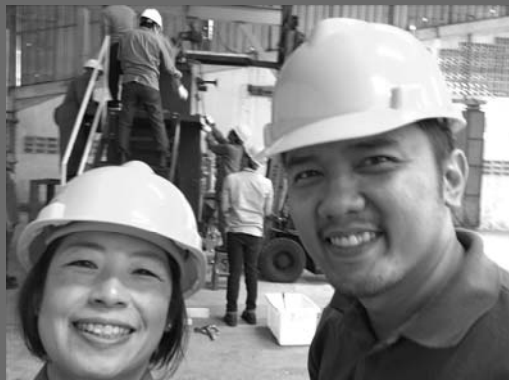
インドネシアにて ↑工場での一枚